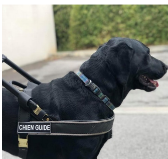
Foto: Arnés de cuero para perro Labrador guía