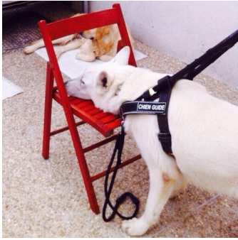
Foto: Arnés de cuero con asa desmontable y pegatina funcional

Podrá complementar el arnés cuero perros guías con una pegatina inscripción funcional , según la actividad de su perro.