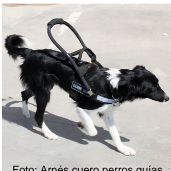
Foto: Arnés cuero perros guías