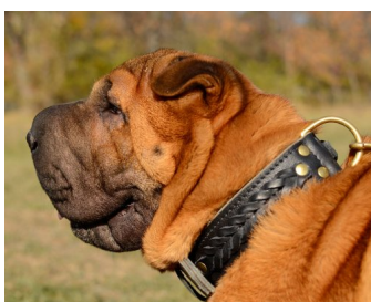
Foto: Sharpei con ancho collar doble trenzado