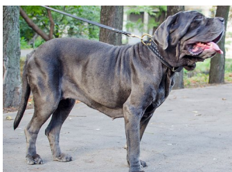
Foto: Collar perro trenzado clásico