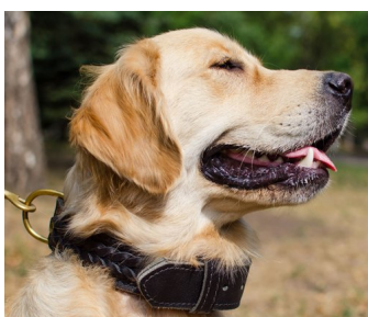
Foto: Collar ancho de doble capa de cuero