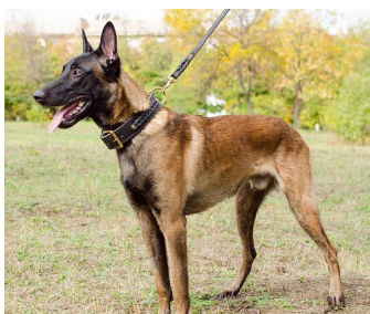
Foto: Collar doble capa trenzado clásico