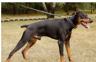
Foto: Collar doble capa y trenzado clásico