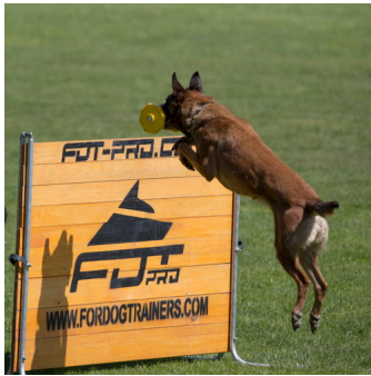
Foto: Barrera de madera y aluminio para competiciones de perros