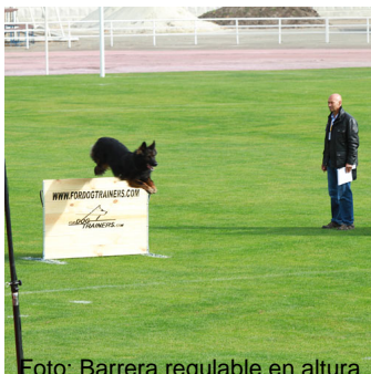
Foto: Barrera regulable en altura