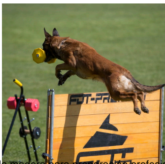
Foto: Barrera de madera para preparación profesional de malinois