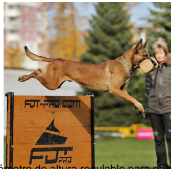
Foto: Saltómetro de altura regulable para perros malinois