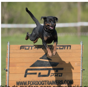
Foto: Valla de madera para preparación para IGP