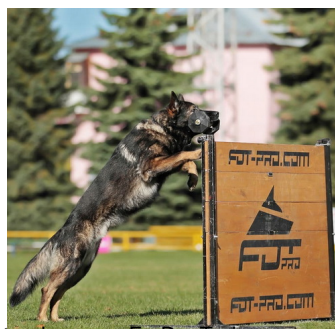
Foto: Saltómetro de marca ForDogTrainers para entrenar perros