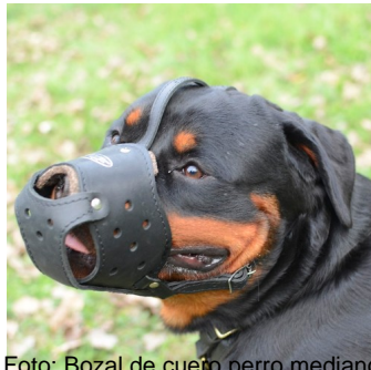
Foto: Bozal de cuero perro mediano