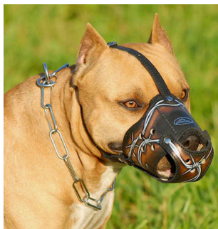
Foto: Básico bozal pintado a mano con alambre de espino