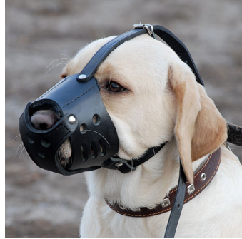
Foto: Básico bozal defensa y ataque