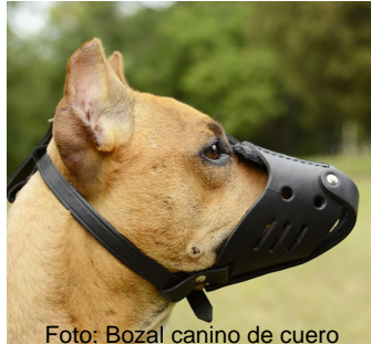
Foto: Bozal canino de cuero