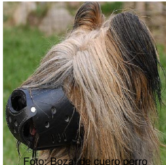
Foto: Bozal de cuero perro