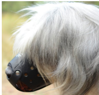
Foto: Básico bozal de cuero perro entrenado