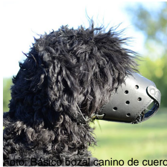
Foto: Básico bozal canino de cuero