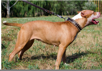
Foto: Collar lujoso de elementos metálicos