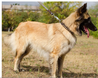
Foto: Collares de elementos metálicos y diseño lujoso