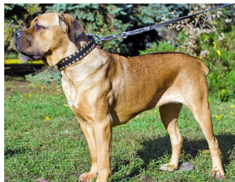
Foto: Collares de perros fuertes de elementos metálicos