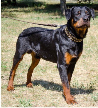
Foto: Collares cuero lujoso de elementos metálicos