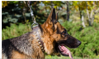
Foto: Collar cuero lujoso con apliques metálicos