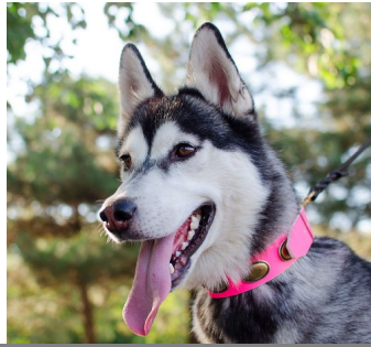
Foto: Collar cuero rosa y medallones latón