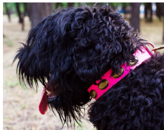
Foto: Collar paseo cuero rosa y medallones latón