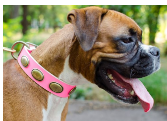
Foto: Bóxer con collar excéntrico paseo cuero rosa y medallones latón