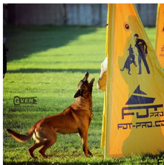
Foto: Escondite para entrenamiento de malinois (foto de Daria Khrustaleva)