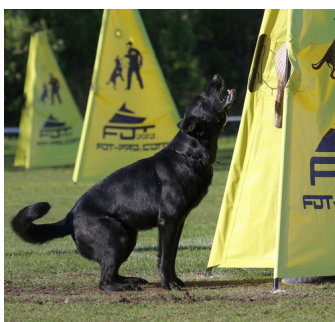
Foto: Escondite para entrenador de perros