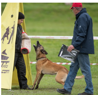
Foto: Escondite para preparación de competencias IGP