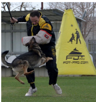
Foto: Escondite para figurante canino